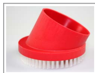
Bürstenaufsatzdüse Art.-Nr.: 601407br